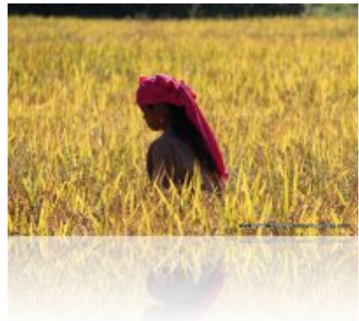
Lao moissonnent. Le travail se fait à la